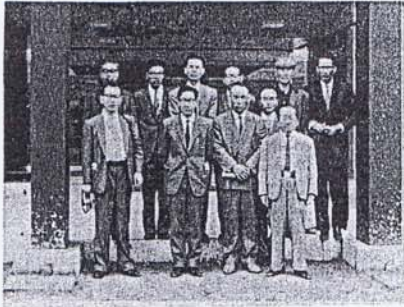
今年度の卒業生に対する、各卒業生の代表者として、各卒業生一人、の進路状況を分析し、

お互いに四十を越すと体力のおとろえを自覚し頭のことか心配になつてくる。昔の人の云う厄年なるもの、この更年期の出たもの、思ふが諸兄の久欠返事の中に「病気の為欠席」と云うのを拝見し、一日も早く回復して頂くよう祈つておられます。また海寄りの庭の一角にはエリカの花が雨に拭われ花が一段とその美しさを発揮している。さて宴会は例によつて盛